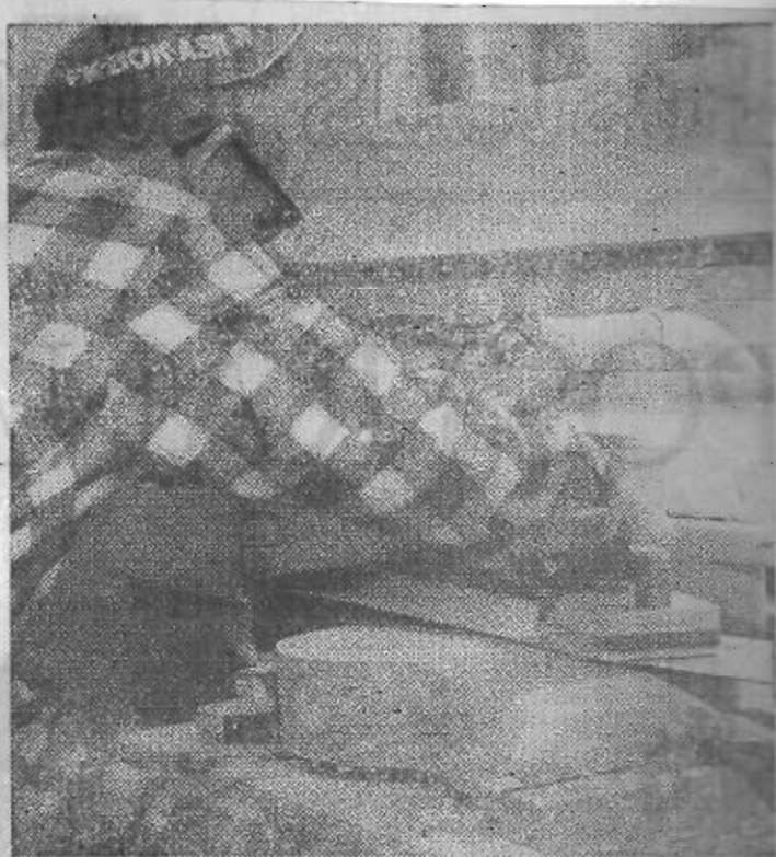
Först maskinputsas gitarrkroppen för att få bort alla ojämnheter, därefter blir det handputs som ger den slutliga finishen.